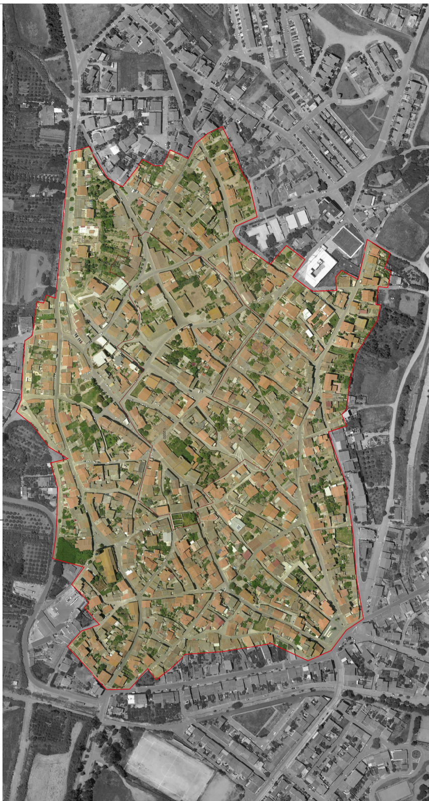
COMUNE DI SQUARUSSA | PROVINCIA DI ORISTANO | PIANO PARTICOLAREGGIATO DEL CENTRO STORICO

CORPORATORE UFFICIO DEL PIANO | Arch. Gianfranco Sanna Studio di Progettazione - via D'Acquisto, 16 - Oristano - tel: 0783/354595